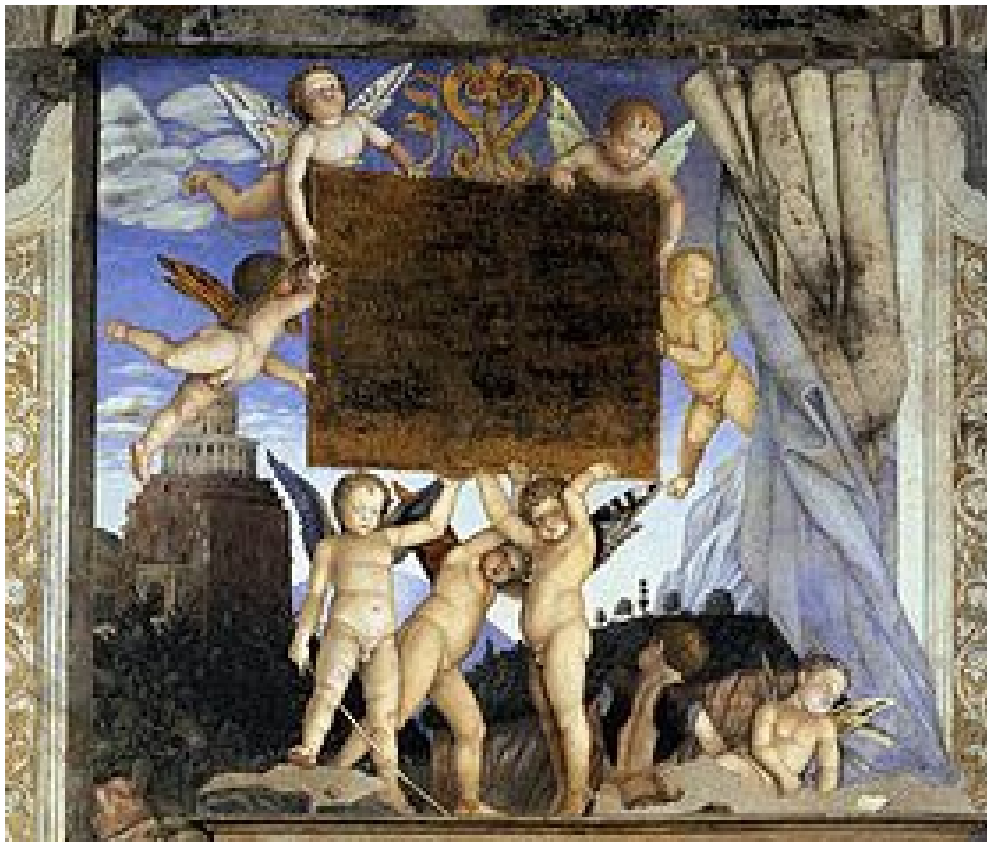
La oració a l'hort

Ubicació: Palau Ducal de Mantua, Mantua (Itàlia)