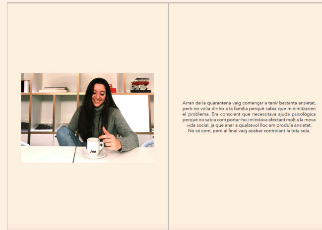
Figura 3. En una pàgina la imatge i en la pàgina del costat el text.