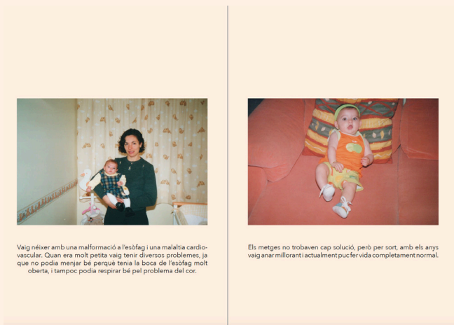
Figura 2. Text com a peu de foto.