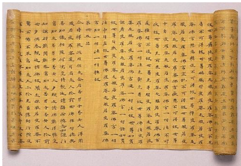
“La gran virtud del saber”. Caves de Mogao (Xina). Segle V aC. Materials: rotllo manuscrit en seda.

En la dinastia Han es va començar a utilitzar el pinzell i els caràcters s'escribien amb tinta xinesa als rotllos de seda.