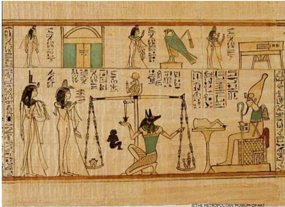
Papirs. 3000 aC. Egipte. Materials: plantes del costa del riu Nil (lino), cel·lulosa i cola + tintes.