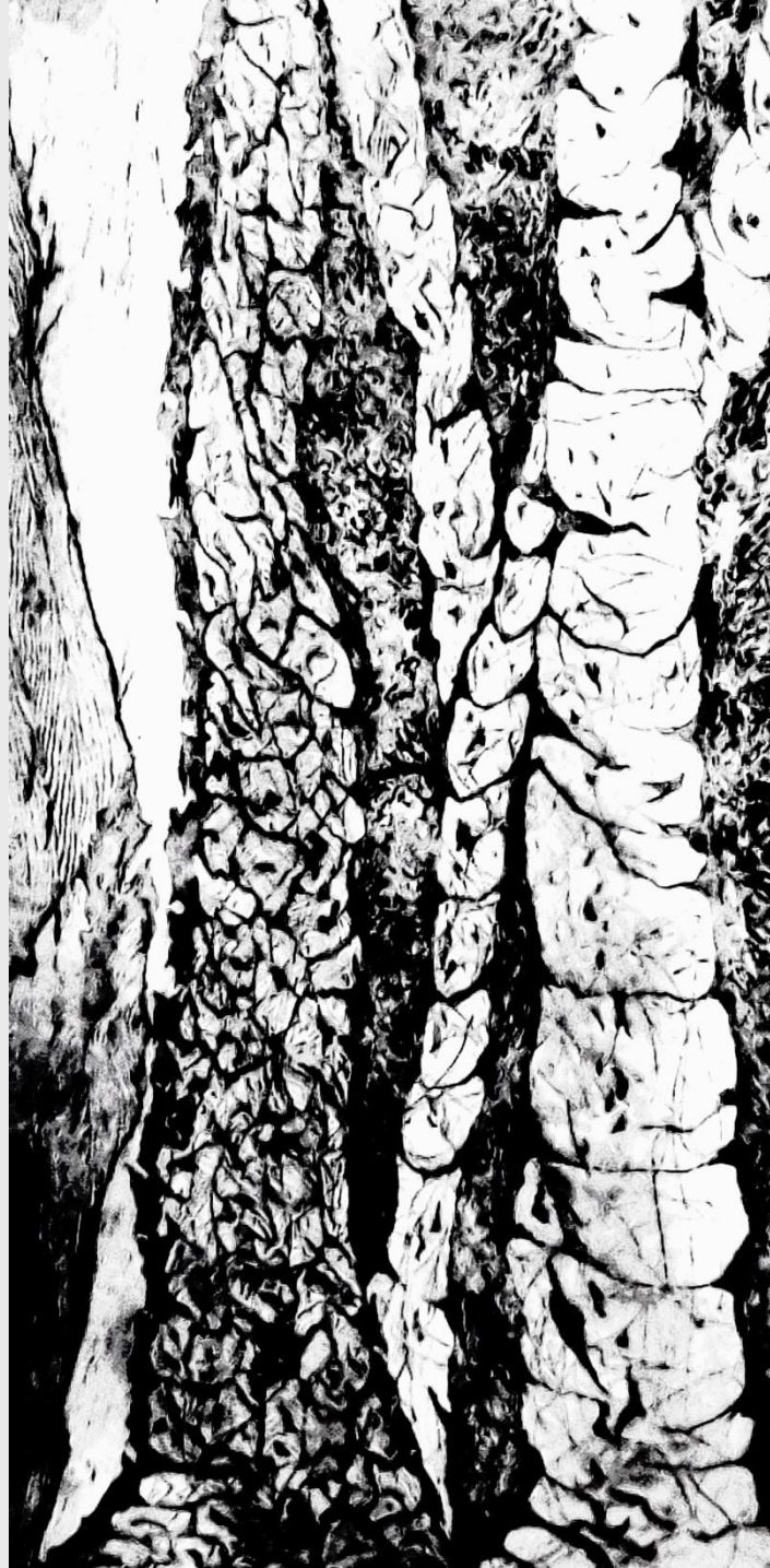
Des de les entranyes