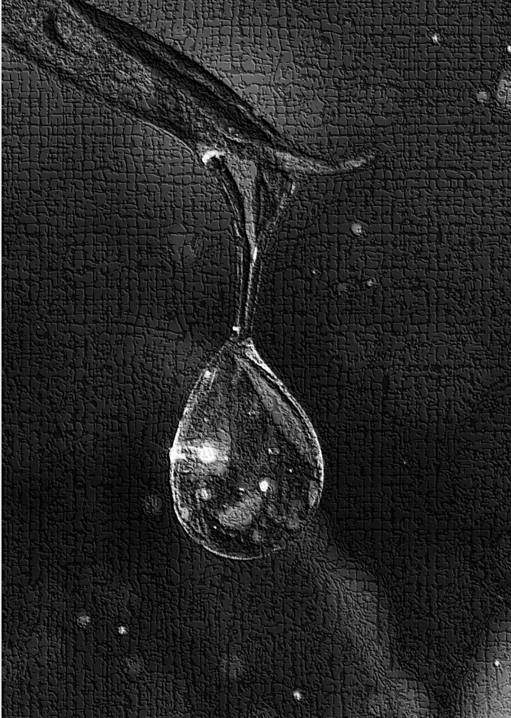
L'origen de tot