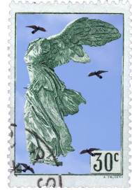
Nike tes Samothrákes, 190 a.C., Antigua Grecia Other Playful Endings, Carla Tejedor Profitós

Su pelo se enreda, sus mofletes se destensan y su boca se rie. Carmina respira, respira muy hondo. ¡Sus pulmones tenían tanta hambre! El aire entra eufórico y descarado, ni pregunta, se cuela y explota. Carmina se olvida de quién es Carmina, y se deja llevar.