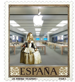
Las Meninas, 1656, Diego Velázquez Other Playful Endings, Carla Tejedor Profitós

- Margaritaaa!!! ¡Haz el favor de dejar el teléfono! ¡Este pintor es muy caro y lo estás desconcentrando! ¡Te va a pintar con el aparatito en la mano, lo que faltaba!!