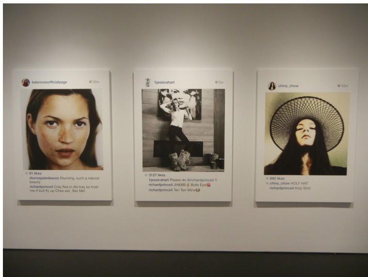
Richard Prince (New Portraits) 2014