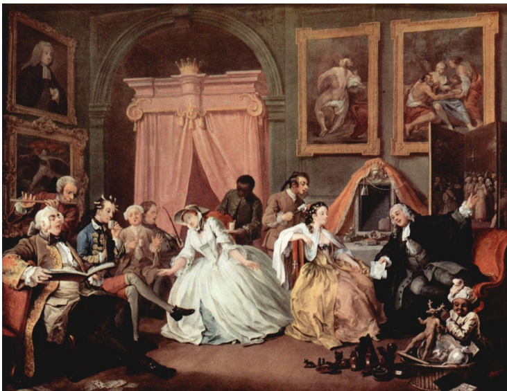
William Hogarth (Marriage-à-la-mode) 1743-1745