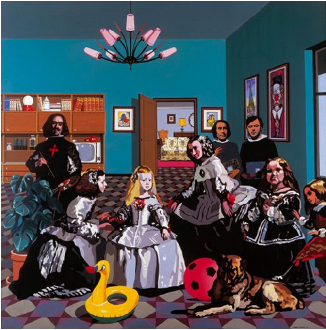
Equipo Crónica (La Salita) 1970