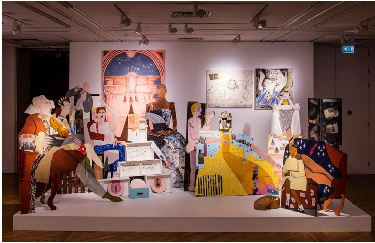
Lubaina Himid (A Fashionable Marriage) 1986