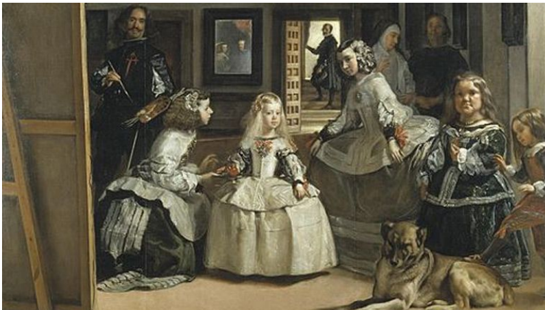
Diego Velázquez (Las Meninas) 1656