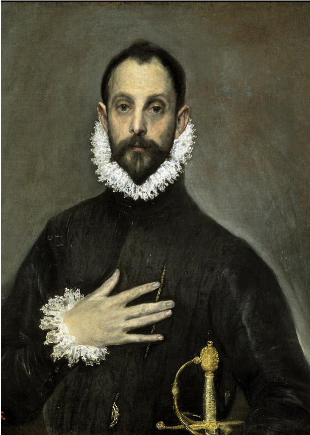
El caballero de la mano en el pecho

fue un pintor y escultor italiano. Muerto prematuramente a los 35 años, trabajó principalmente en Francia. Es conocido por sus retratos y desnudos en un estilo que se caracterizaba por el alargamiento de los rostros y las figuras, lo cual no fue bien acogido durante su vida, pero que logró gran aceptación posteriormente.