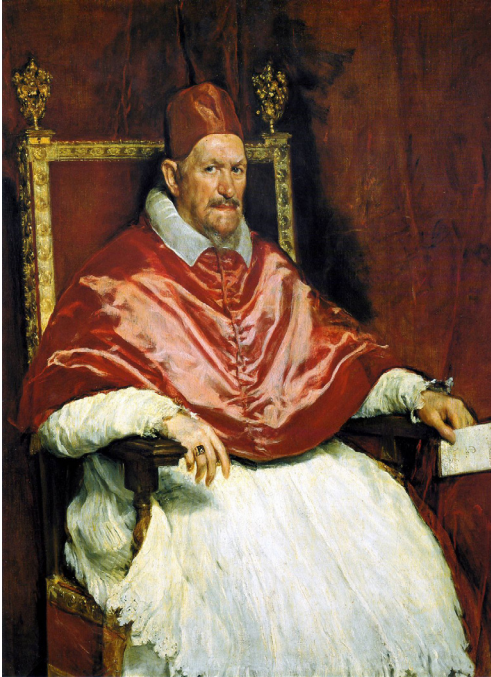
Inocencio X (Velázquez) Técnica: Oleo sobre lienzo Año: 1650

Francis Bacon (Dublín, Irlanda, 28 de octubre de 1909-Madrid, España, 28 de abril de 1992) fue un pintor de estilo figurativo idiosincrásico, caracterizado por el empleo de la deformación pictórica y gran ambigüedad en el plano intencional.