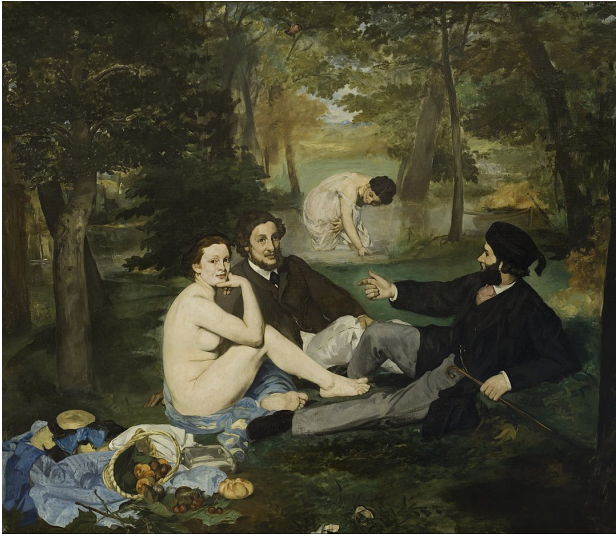
Le Déjeuner sur l'Herbe

Alain Jacquet fue un artista francés, nacido en Neuilly-sur-Seine, Francia. Es ampliamente reconocido como un representante francés del movimiento del pop-art estadounidense, un movimiento artístico visual que surgió en la década de 1950.