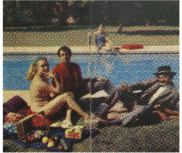
Almuerzo sobre la hierba