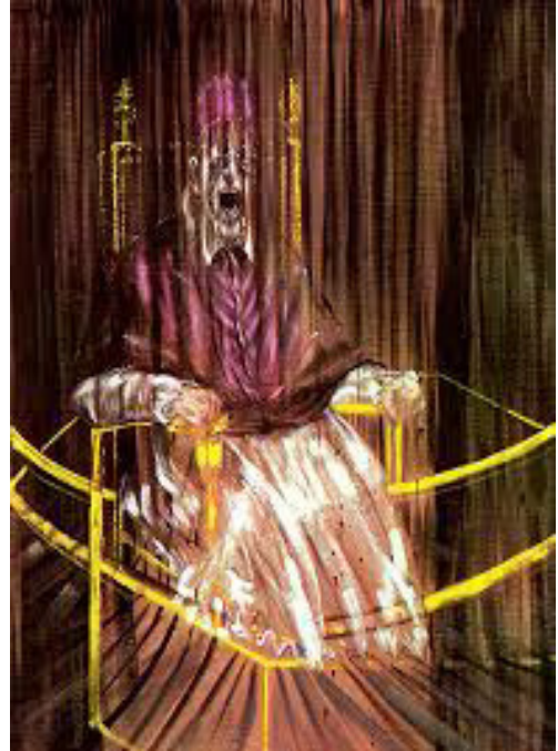
Estudio según el retrato del Papa Inocencio X de Velázquez Técnica: Oleo sobre lienzo Año: 1953