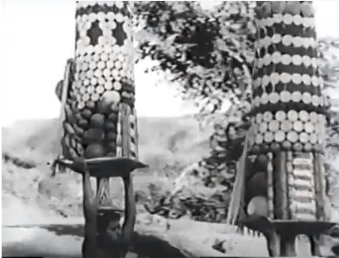
A movie Bruce Conner 1958 Duració: 12min Blanc i Negre

A movie és una pel·lícula de 12 minuts format per seqüències d'antiguitats de pel·lícules i extractes de notícies contemporànies, amb els quals Conner crea un collage personal i agressiu, símbol d'un cine transgressor i alternatiu. Una pel·lícula, que es considera precursora dels futurs videoclips, va ser seleccionada el 1991 pel Registre Nacional de Cinema de Estats Units per ser preservada a la Biblioteca del Congrés.