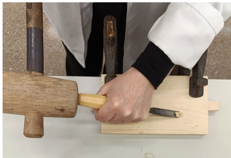
Fig.5 Imatge de l'ús de la maça en el moment de tallar la fusta.