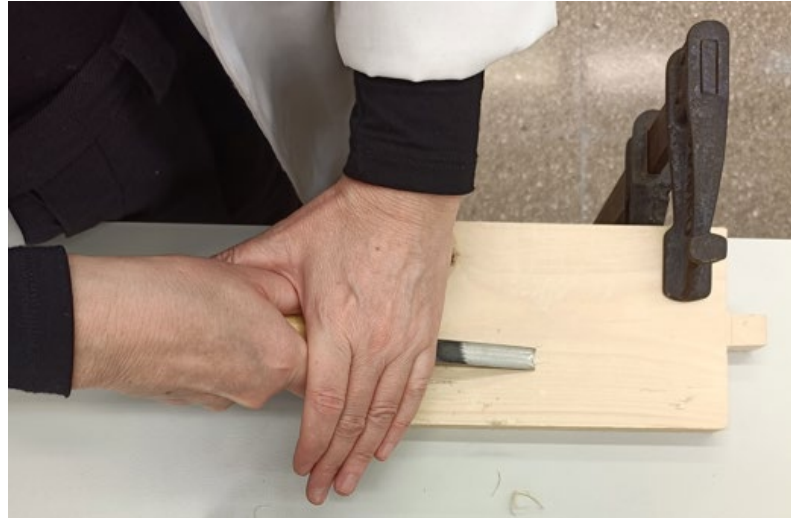
Fig. 4 Imatge del moment de presentació amb la peça i subjecció de la gúbia.