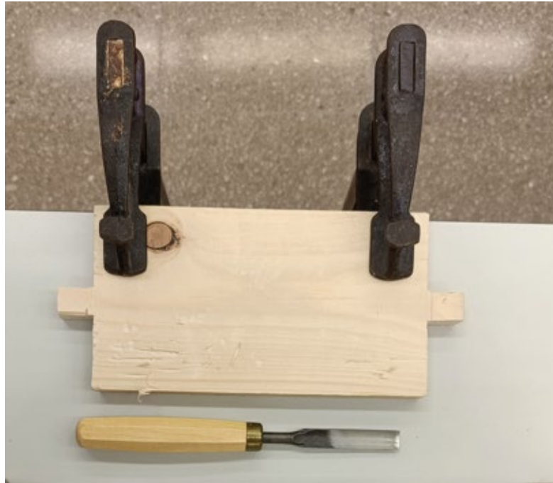
Fig. 2 Imatge de la peça a tallar subjectada a la taula amb els sergents.