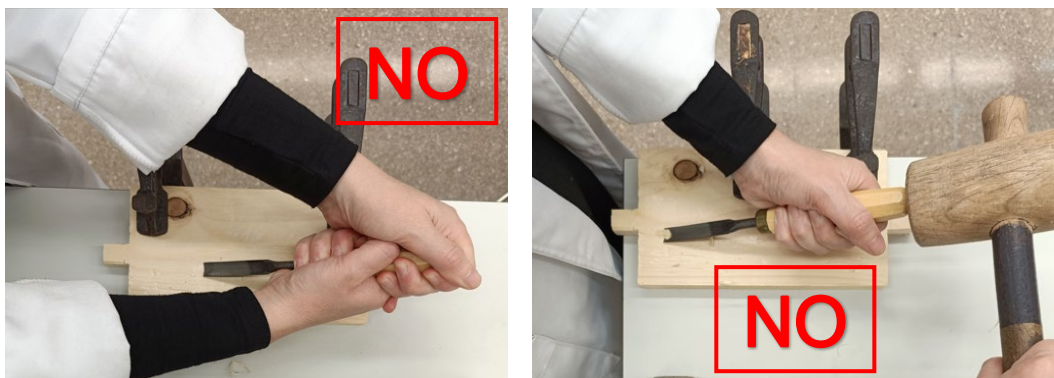
Fig. 6 i 7 Imatges de com NO s'ha de fer ús de l'eina, amb maça o sense.