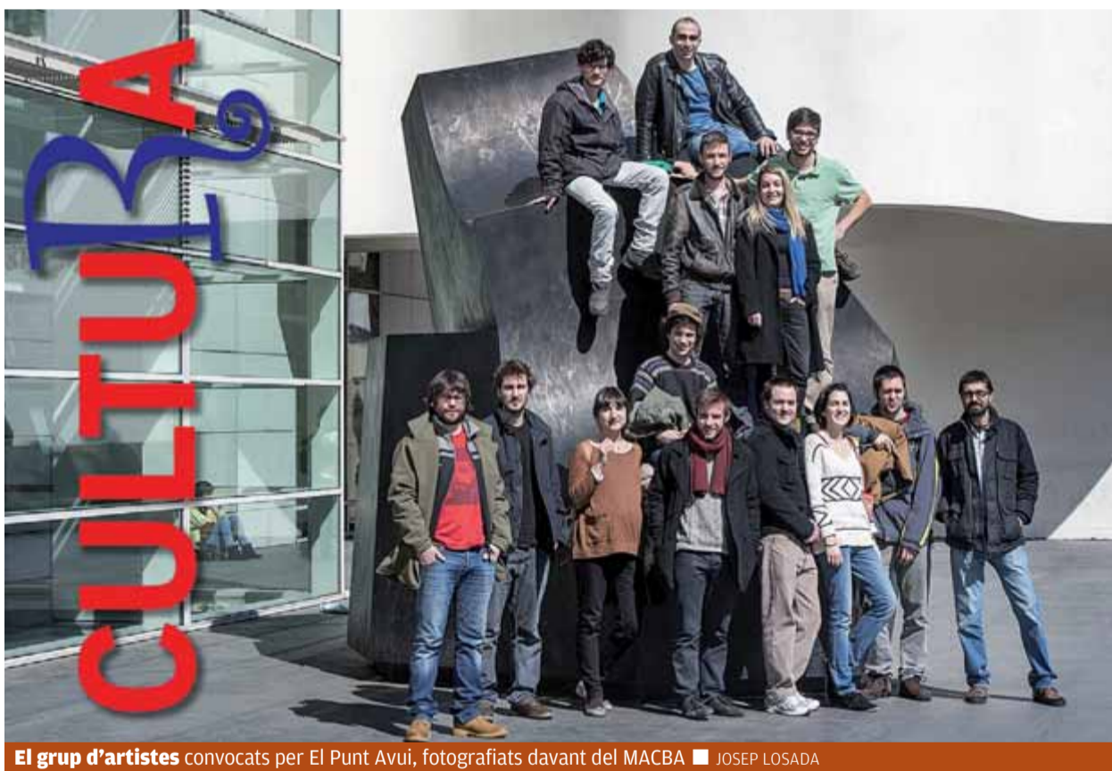
El grup d'artistes convocats per El Punt Avui, fotografiats davant del MACBA

CONFIANÇA • CiU pensa que al final hi haurà entesa amb els republicans ■ P4,5