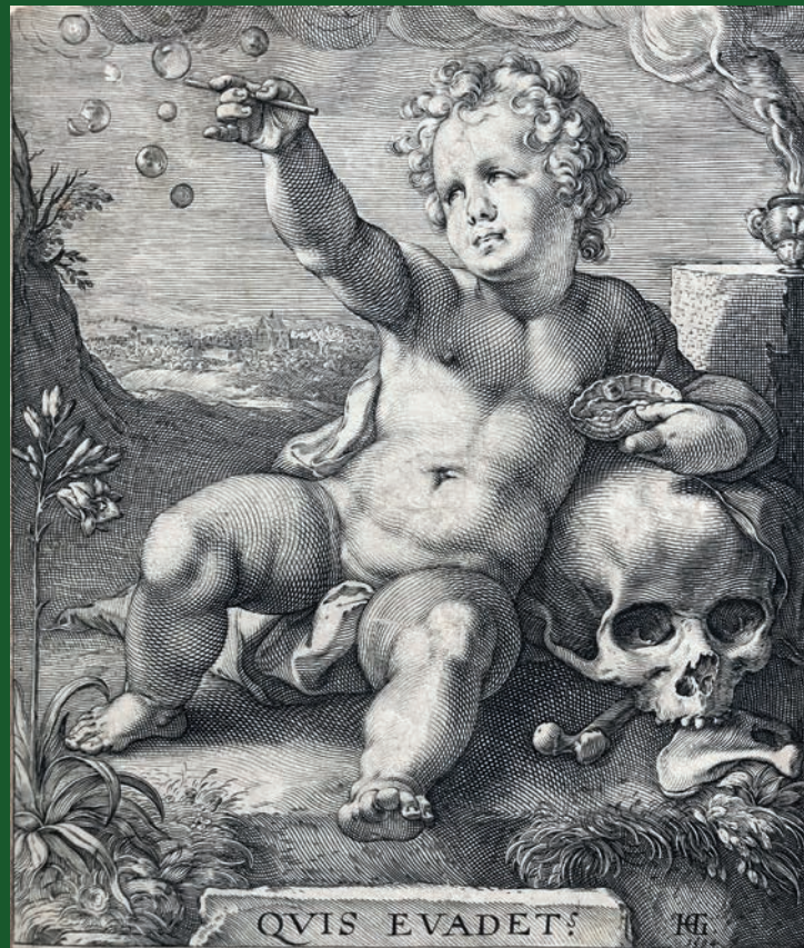
Hendrick Goltzius. Quis Evadet? (Qui s'escaparà?). 1594