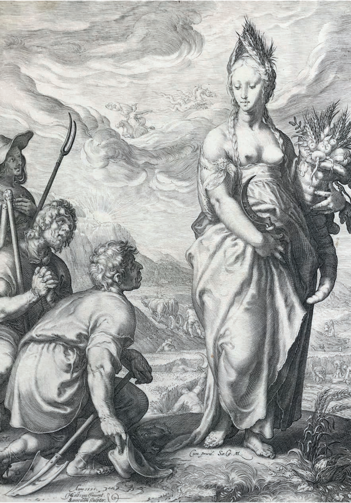
Jan Saenredam. Els pagesos reten culte a Ceres . 1596