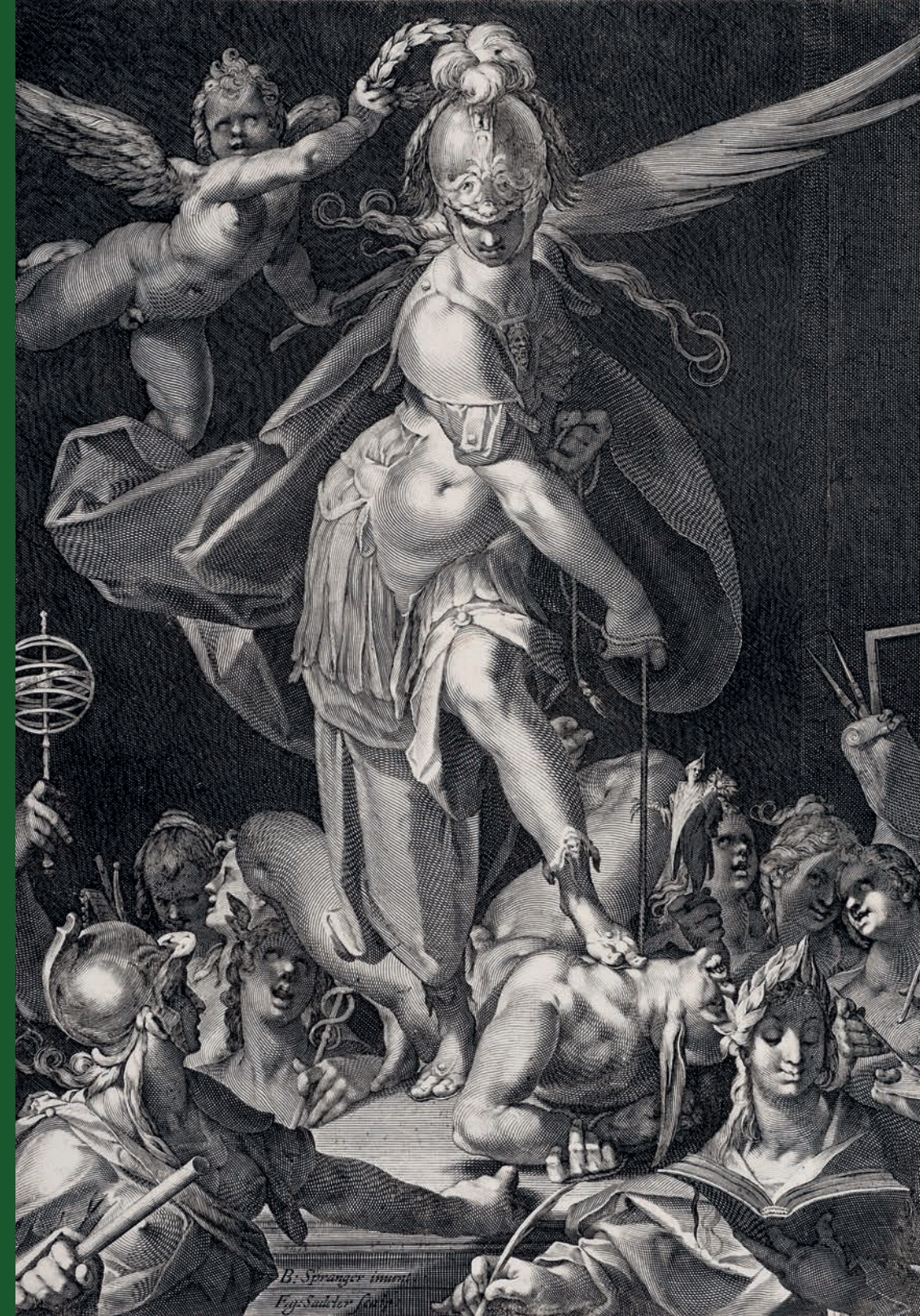
Aegidius Sadeler. La Saviesa venç la Ignorància , c. 1600