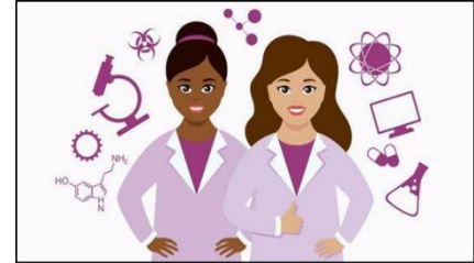
TROBADA ENTRE CIENTÍFIQUES I NOIES D'INSTITUT