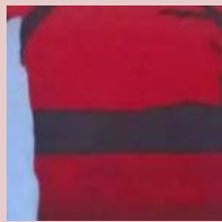
Postcolonial Studies UB - Africa