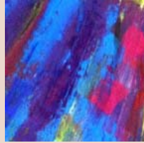
Postcolonial Studies at UB Showroom