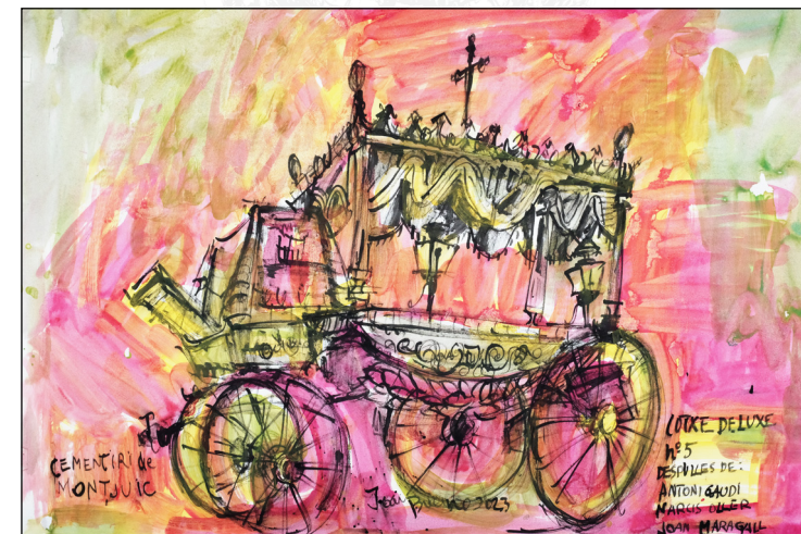
Carrossa fúnebre de luxe. Museu de les Carrosses. Cementiri de Montjuïc.