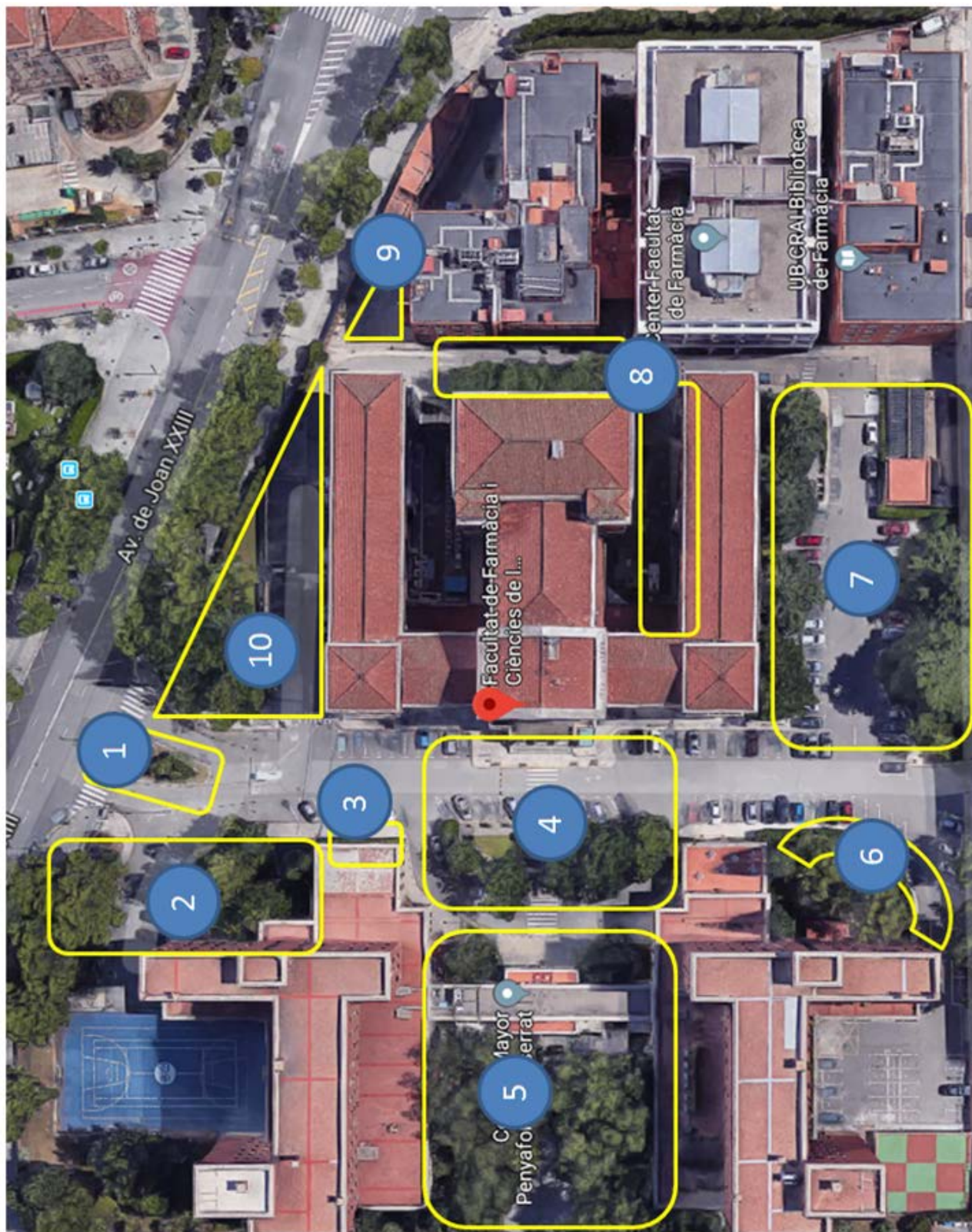
Aquesta activitat s'emmarca en el PID 2018PID-UB/034 Innovació en l'ambientalització curricular de la Botànica en el grau de Farmàcia: Jardins per a la salut , del Vicerectorat de Política Docent i Ordenació Acadèmica.