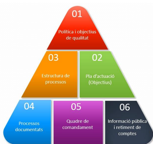
Figura 1. Estructura del SAIQU 2019

Fruit del procés de revisió i millora l'any 2019 es va actualitzar el SAIQU. Aquesta actualització ha facilitat el compliment de les directrius de l'AQU Catalunya per a la Certificació del Sistema de Garantia Interna de la Qualitat (SGIQ). Així, tots els centres propis de la UB disposen d'un model general de SAIQU, que s'estructura en 6 eixos, tal com mostra la figura 1: