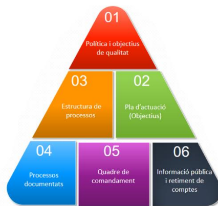
Figura 1. Estructura del SAIQU 2019

Tots els centres propis de la UB disposen d'un model general de SAIQU, que s'estructura en 6 eixos: