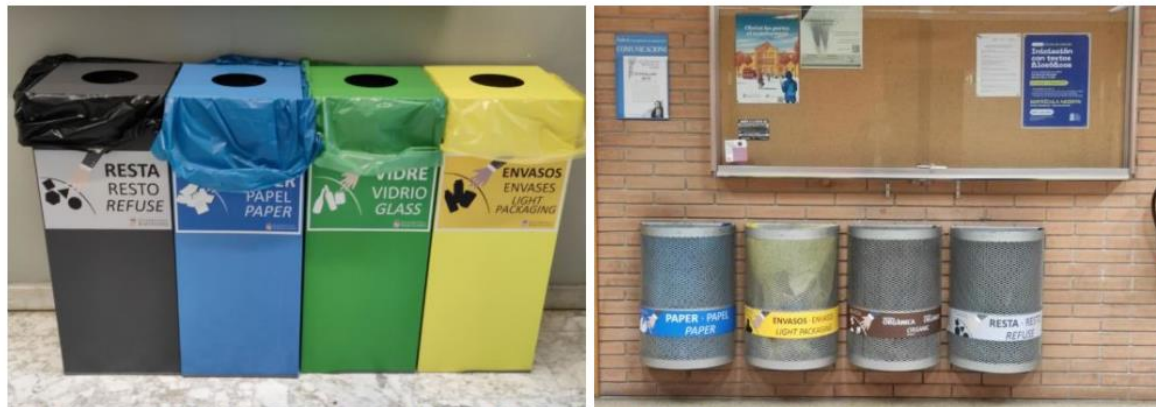
Punts de recollida selectiva a l'edifici Històric (esquerra) i a l'aulari Josep Carner (dreta)

Estat: FINALITZADA 2022. AMB CONTINUÏTAT 2023