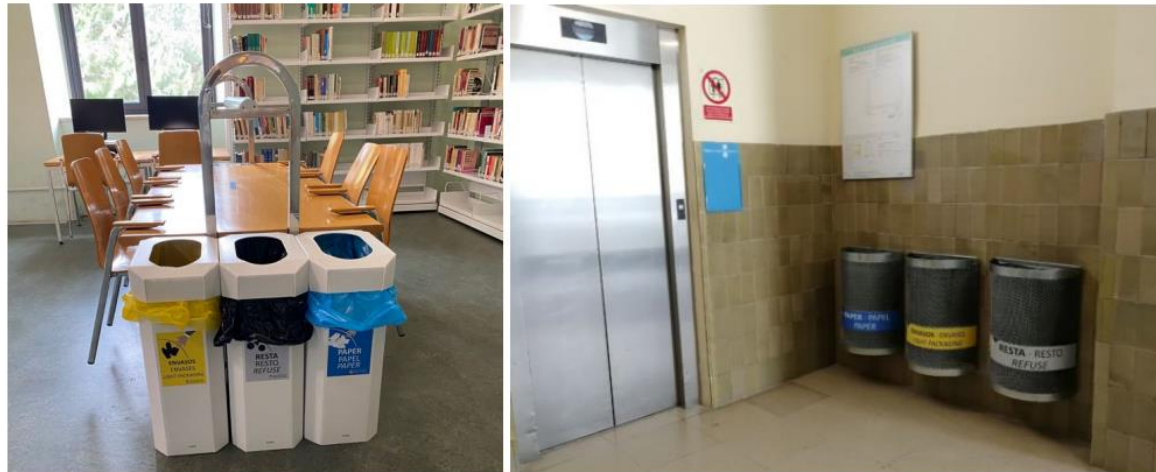
Punts de recollida selectiva al CRAI Biblioteca del Campus Mundet (esquerra) i a la Facultat d'Informació i Mitjans Audiovisuals (dreta)