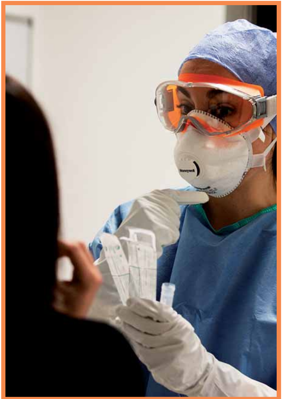
Una professional sanitària, fent seguiment a pacients amb covid-19.

Autor: Salvador Macip Editorial: La Campana (2020)