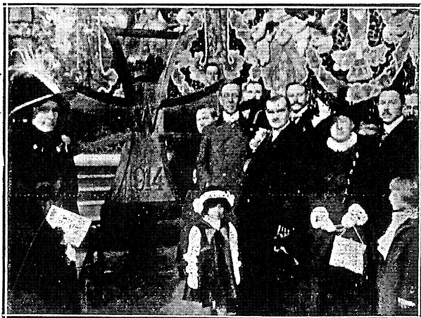
BARCELONA. — Los Cónsules de Alemania y Austria-Hungría después de haber clavado un clavo en la cruz de madera que representa la «Cruz de Hierro» alemana, la cual fué completamente cubierta de clavos, siendo el importe de los mismos destinado para la Cruz Roja austro-alemana.