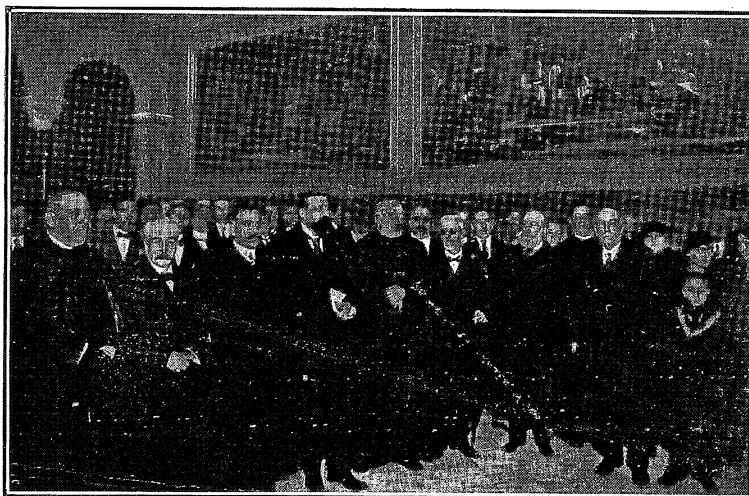
BARCELONA: LA EXPOSICIÓN LULIANA, CELEBRADA EN CONMEMORACIÓN DEL VI CENTENARIO DE LA MUERTE DEL GRAN FILÓSOFO, BEATO RAIMUNDO LULIO

ciaba á sus fieles amados su fin próximo y les exhortaba á amar á Dios, para presentarse limpio de culpas ante El. La asistencia experimentó hon-