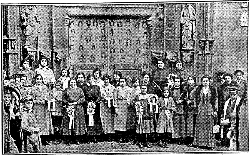
BARCELONA.—La fiesta de la Purificación de la Virgen en San Martín de Provensals: Señoritas que vendieron candelas para los pobres.