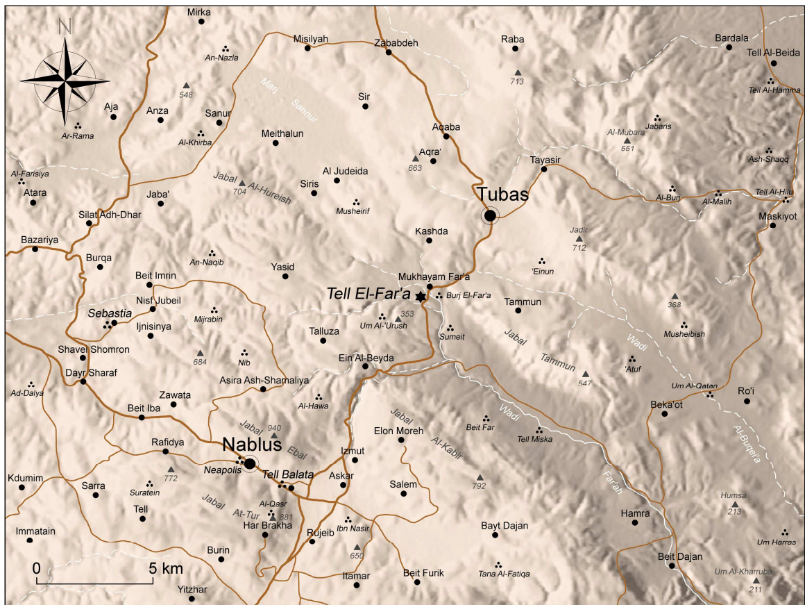
1. Situación geográfica de Tell el-Far'a, entre Nablús y Tubas.