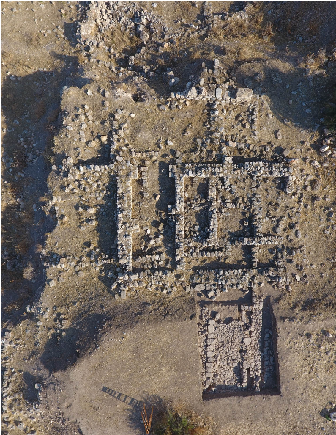
5. Ubicación del sondeo A en el sector occidental del tell.