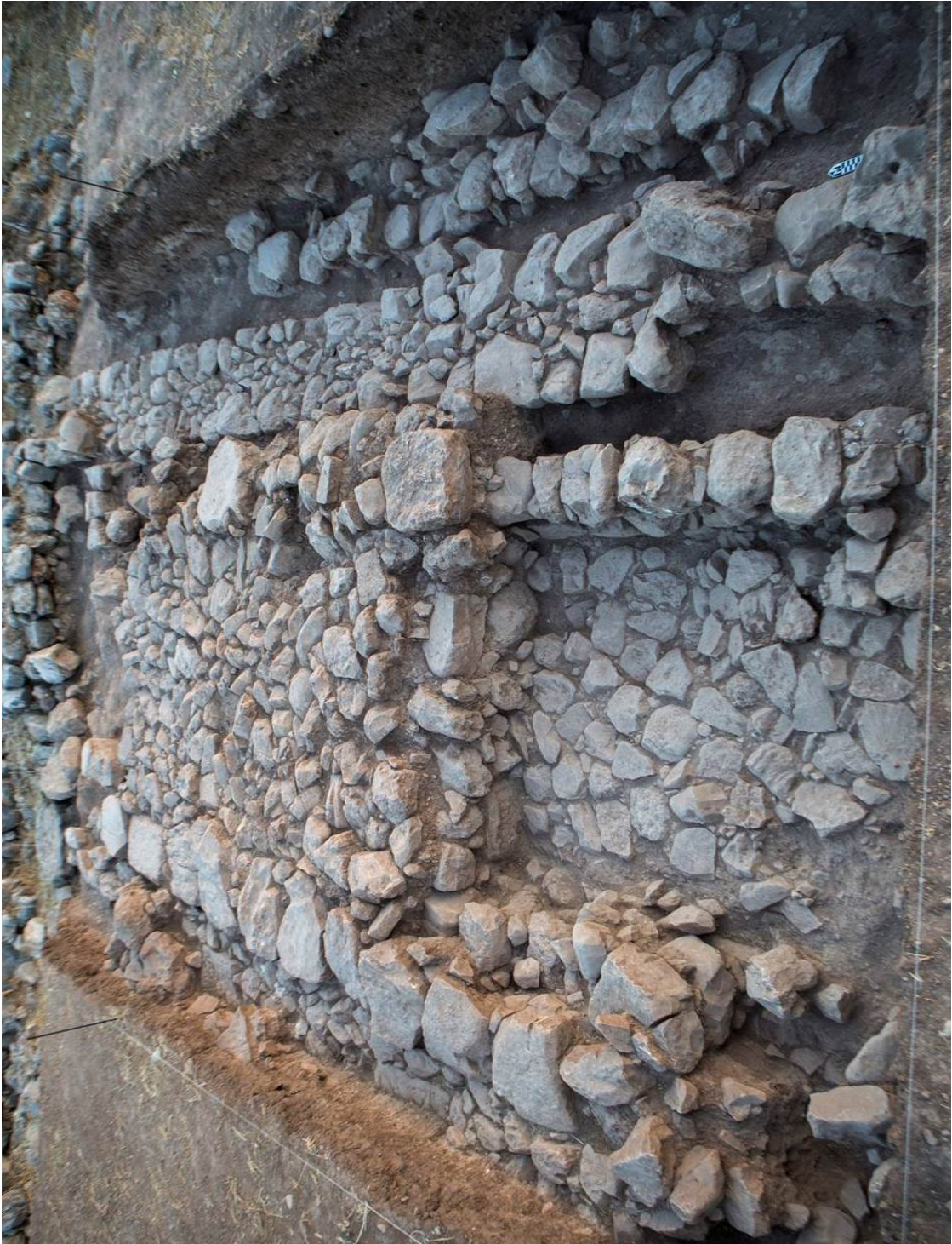
7. El sondeo A, una vez finalizada la excavación, en octubre de 2017.