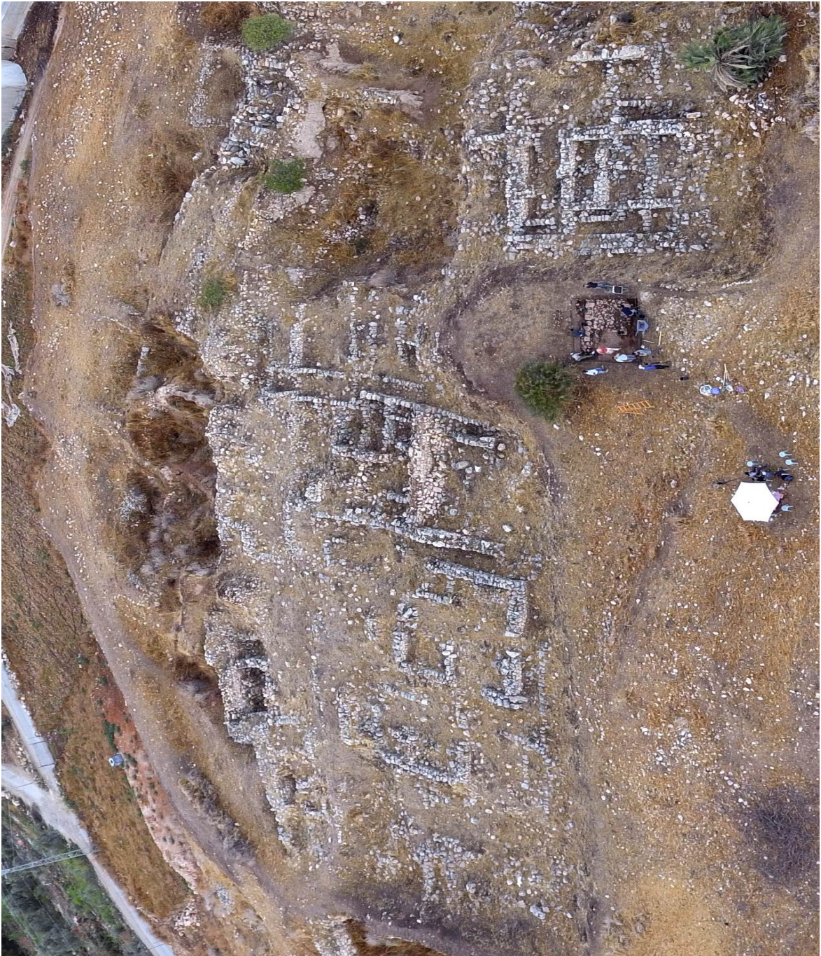
4. Foto aérea del sector occidental de Far'a excavado por el equipo francés.