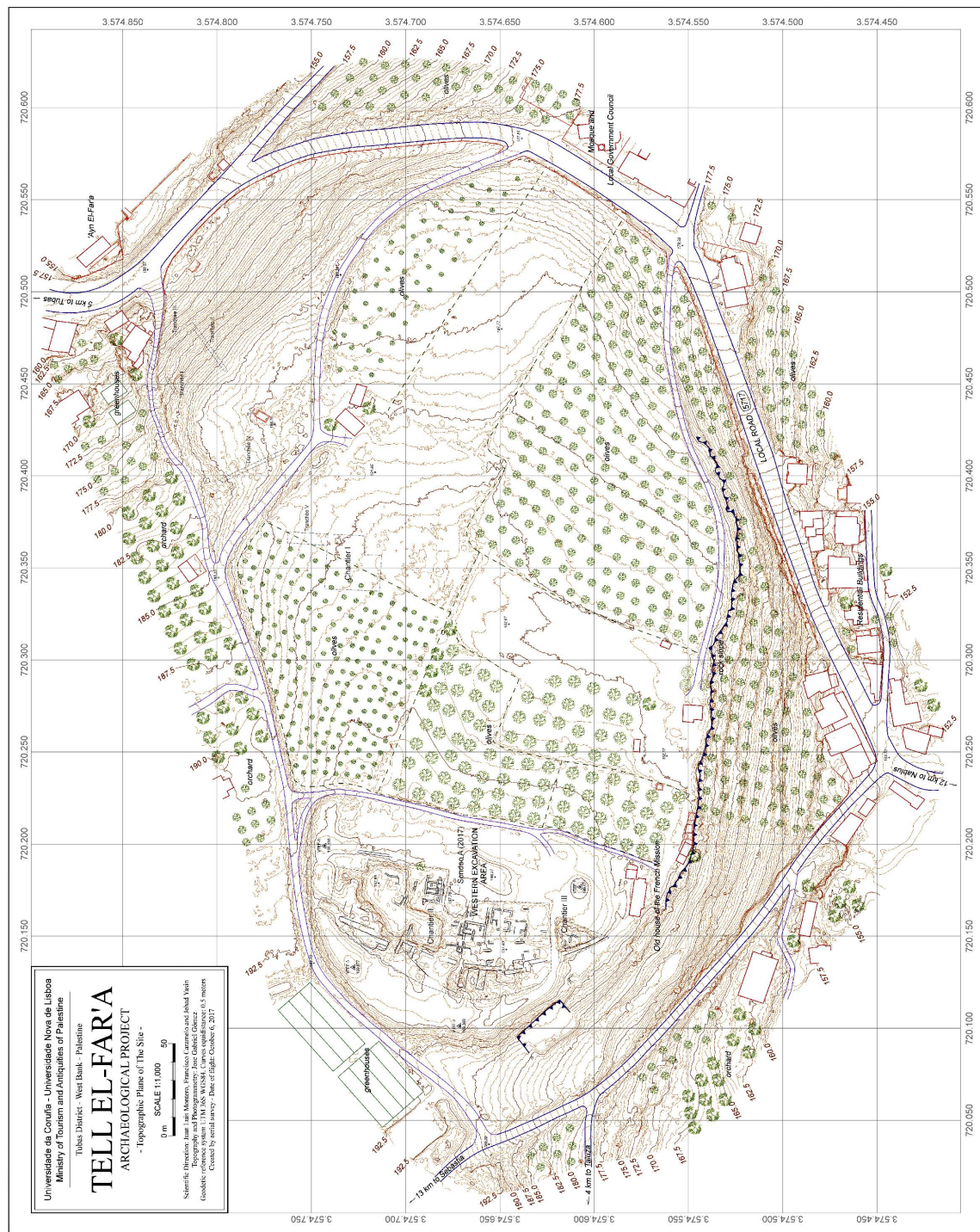
3. Plano topográfico de Tell el-Far'a en octubre de 2017.