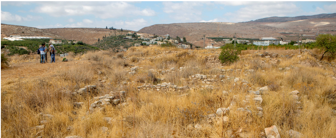
2. Estado de conservación del yacimiento en octubre de 2017.