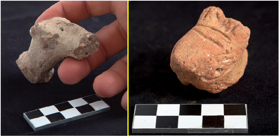
8. Dos figurillas zoomorfas en terracota.