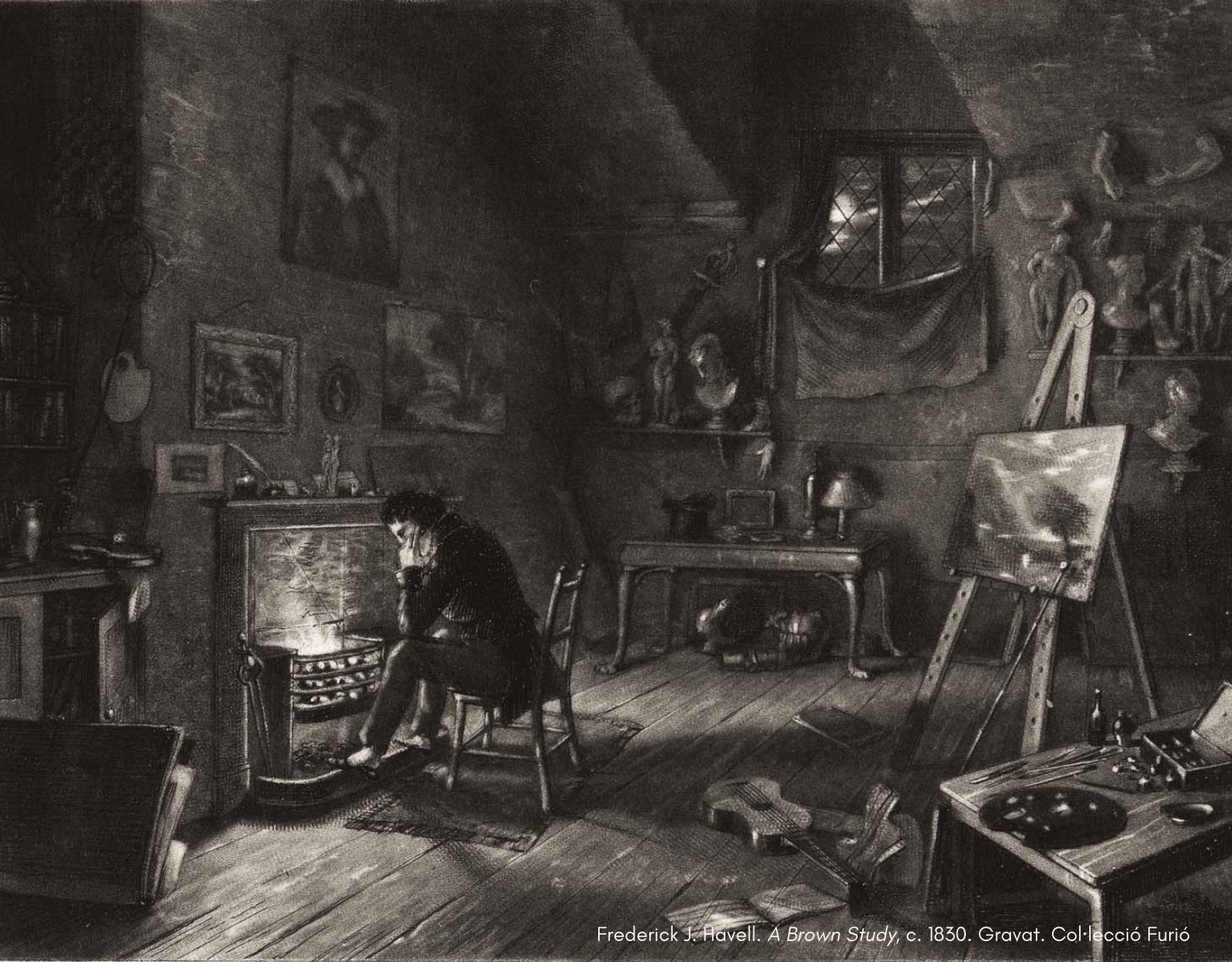
Frederick J. Havell. A Brown Study , c. 1830. Gravat. Col·lecció Furió