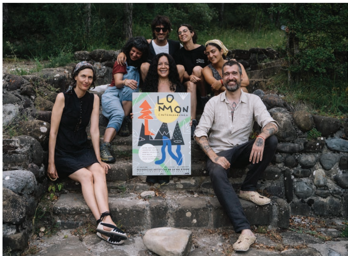
Los artistas residentes en 2023