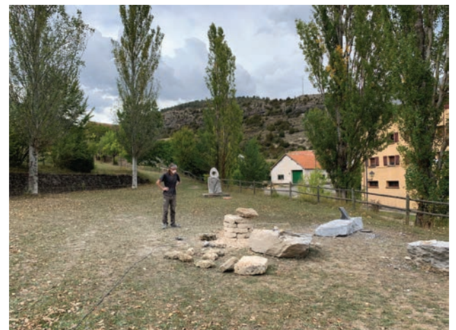
Nacho Arantegui trabajando su pieza "Toscagua" en la campa exterior del Museo de escultura. Lo Mon Contemporáneo 2019.