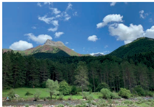
Selva de Oza y una de sus cimas más emblemáticas, el Castillo de Acher.