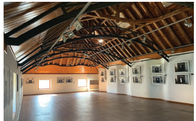
Sala de exposiciones del Pallar d'Agustín. Exposición del fotógrafo José Luis de la Parra. Lo Mon Contemporáneo 2020.