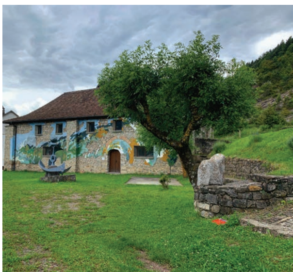
Lo Pallar d'Agustín: Museo de escultura al aire libre de Hecho.

Hoy en día el Valle de Hecho sigue siendo ese lugar inspirador que ofrece a los artistas una naturaleza espectacular y una cultura ancestral que ha corrido paralela a ella, además del encuentro y la convivencia con los vecinos. Una simbiosis cultural que celebra la relación entre mundos distintos, el intercambio de experiencias , la vida rural y el contacto con la naturaleza.