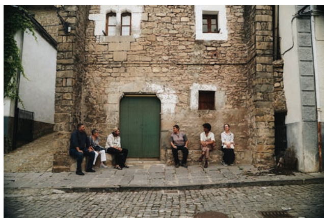
Visita guiada por Hecho que mantiene la arquitectura tradicional de la zona y las características “chamineras”