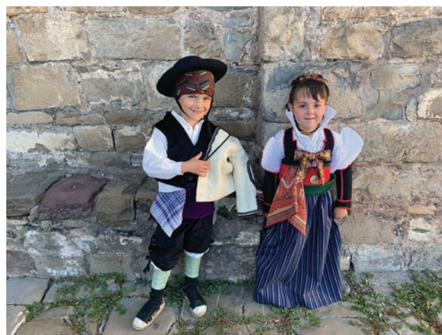
Dos niños chesos vistiendo el traje tradicional.