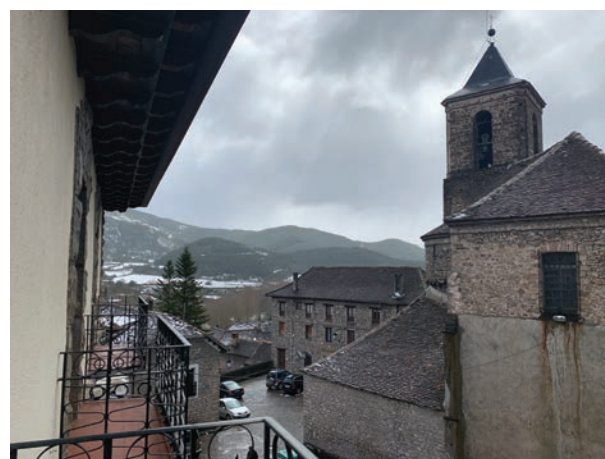
Vista a la plaza Conde Xiquena desde los balcones de la residencia de artistas