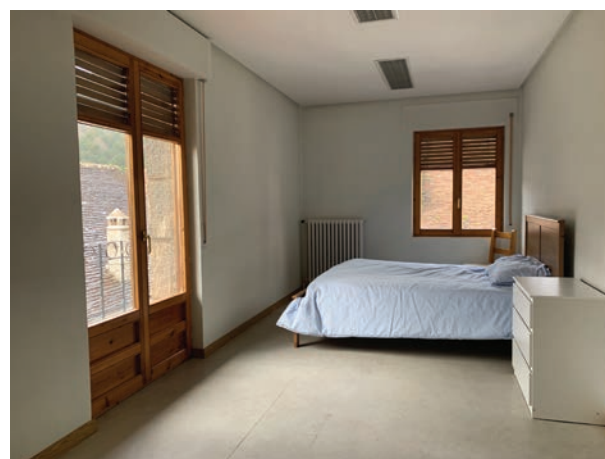
Algunas de las estancias de la residencia