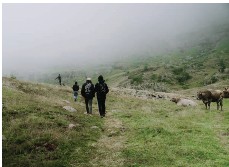
Artistas residentes en 2022 caminando hacia el valle de Aguas Tuertas