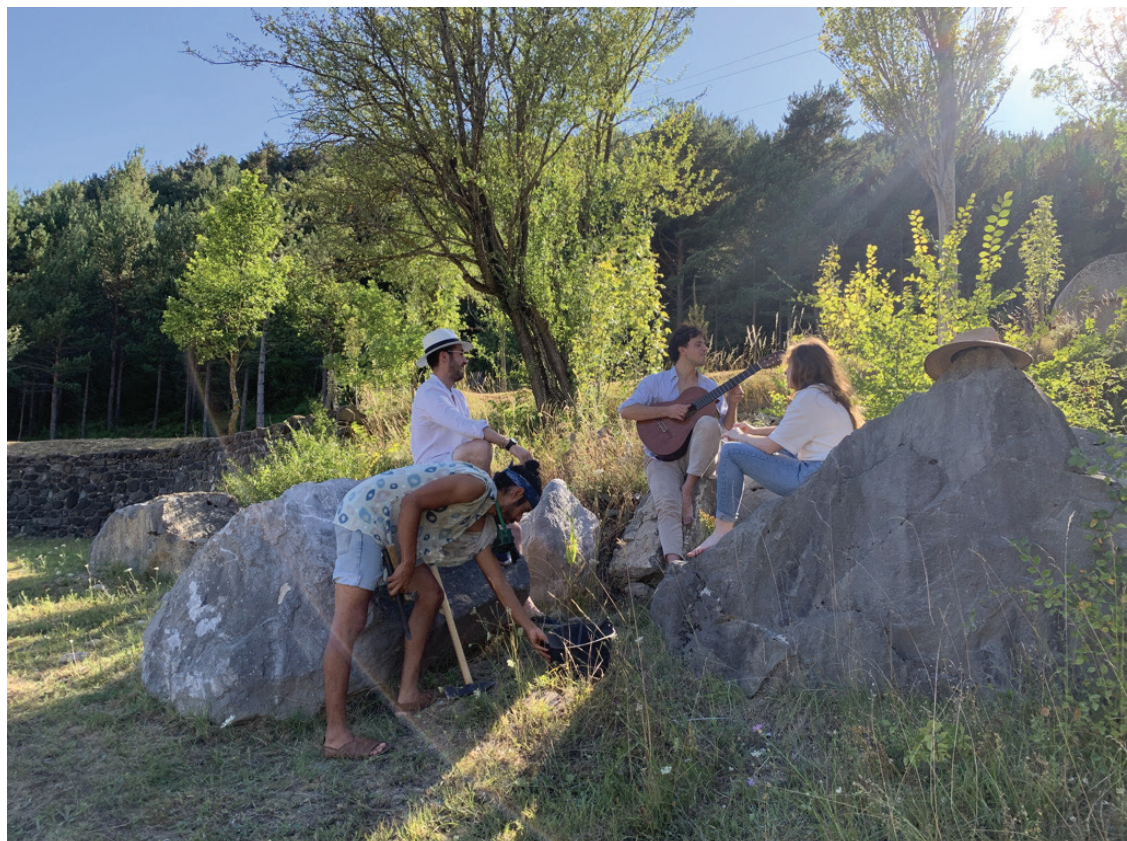
Los artistas de 2021 en la zona de piedras sin trabajar del Museo de escultura

Buscamos una propuesta que revitalice y ponga en valor esos materiales sin trabajar que quedaron abandonados en el Museo de Escultura al aire libre de Echo.