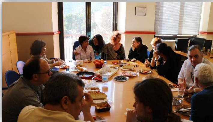
Imatge del dinar comunitari

En definitiva, la recepció dels assistents a la jornada es positiva, doncs l'explicació del ponent es valora satisfactòriament, el contingut del model suposa una referència aplicable a l'hora d'elaborar un nou pla docent, i la discussió sorgida en el si de la jornada ha estat productiva. Aquestes valoracions donen peu a la tercera sessió de la jornada, on es s'aplica el coneixement rebut d'en Daniël Janssens, de la discussió dels assistents i de la valoració final presentada en els últims paràgrafs. No abans, però, d'haver gaudit d'un dinar comunitari, on tots els participants van intercanviar experiències, coneixements, i treballs en un context informal.