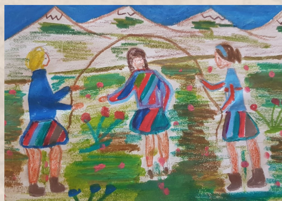
Dibuix fet per un nen. Tesina nº 141: El tiempo libre en la edad escolar