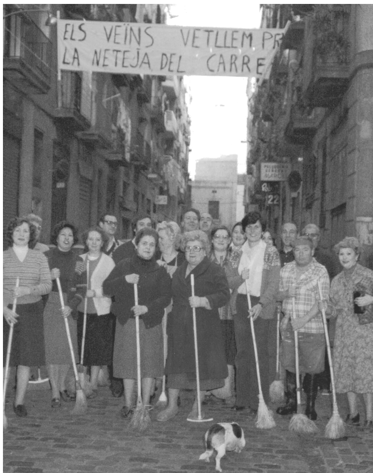
Foto 8. Campanya de neteja amb les veïnes del barri del Raval