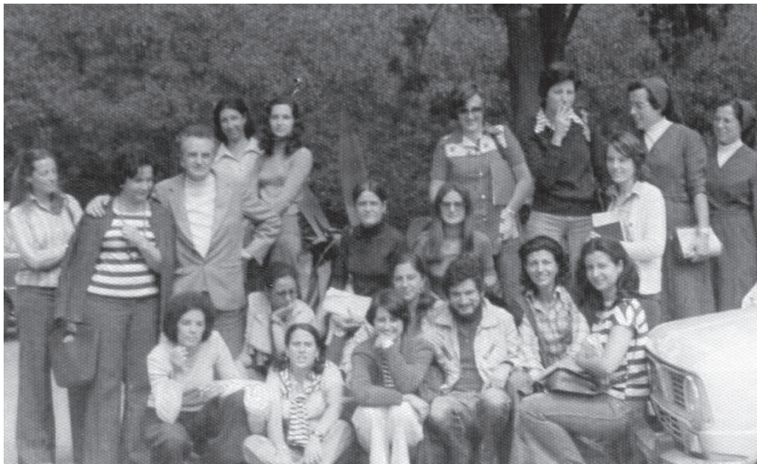
Foto 2. Protesta estudiantil amb motiu de la revàlida.