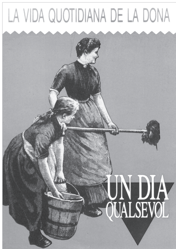
Foto 1. Campanya de sensibilització: la vida quotidiana de les dones. Mercat de la Boqueria. Barcelona. (1986)