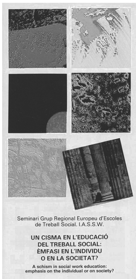
Foto 10. Cartell promocional del Seminari del Grup Europeu d'Escoles de Treball Social de Sitges (1987)