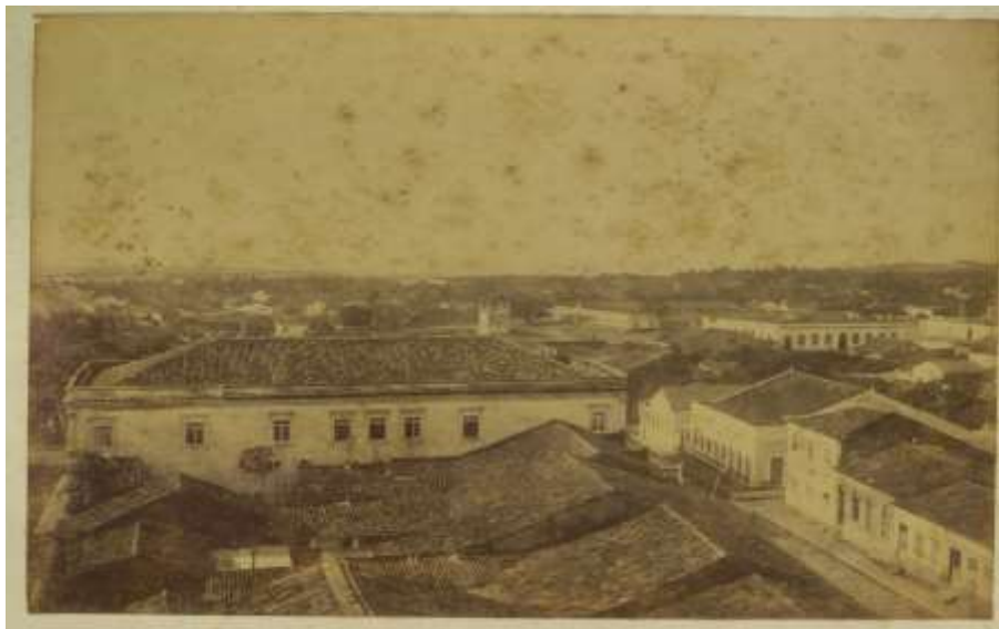
Figura 03. Fundos do palácio do Governo estadual - Natal, 1904. A imagem coaduna com as palavras de Feitosa: “vila pacata de interior”.

Tratava-se do discurso representativo de parcela privilegiada da sociedade potiguar insatisfeita com as feições urbanas da cidade naquele período (Figura 03). Nela, veem-se as “indesejáveis” casas de aparência colonial, além das “ruas impossíveis” e sem calçamento. Ao rejeitarem este desolador cenário, as elites locais, após a adesão republicana 10 , iniciaram ensejos para transformar o que consideravam uma cidade provinciana. Embora a maioria pertencesse a famílias não natalenses, a riqueza proveniente da atividade pecuarista (antes predominante) e da, agora, cana-de-açúcar permitiu aos seus filhos estudarem na capital e ingressarem nas faculdades localizadas em Recife, Salvador e no Rio de Janeiro.