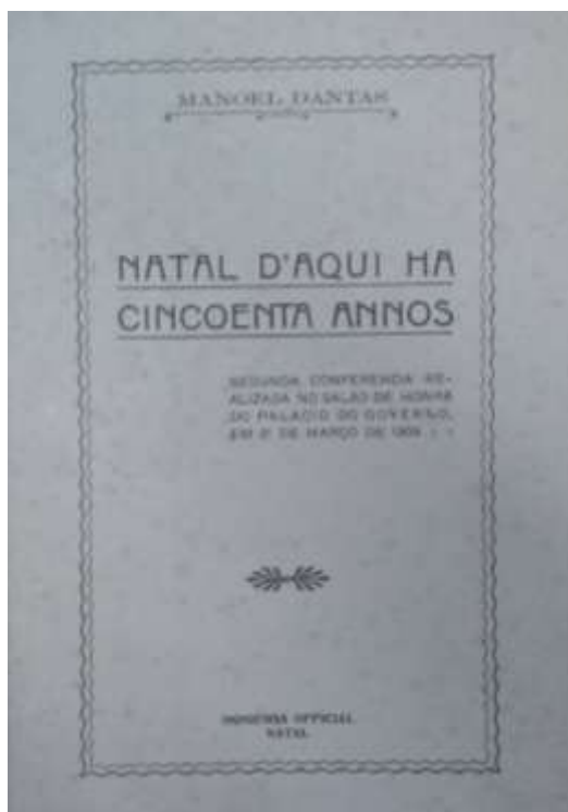
Figura 02. Frontispício da publicação da conferência