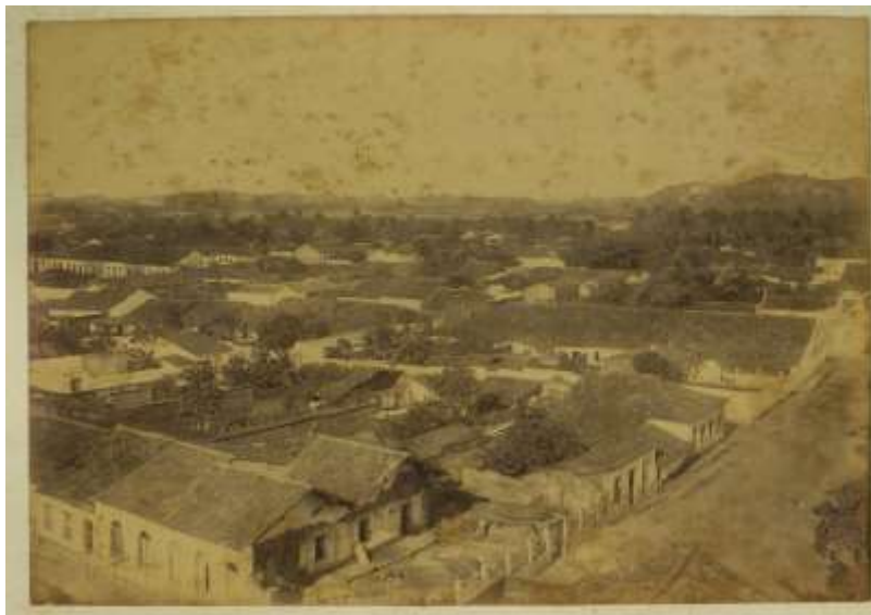
Figura 06. Cidade Alta, 1904. Ao fundo, vê-se as dunas que circundam a capital, o “Perigo Iminente”, de Manoel Dantas