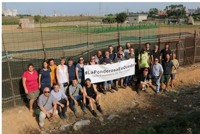
Figura 2. Els components de la Taula per a la defensa de La Ponderosa amb la finca al fons

https://recomtal.wordpress.com/2019/06/10/manifest-lhorta-de-la-ponderosa-ha-de-ser-protegida-com-espai-agricola/