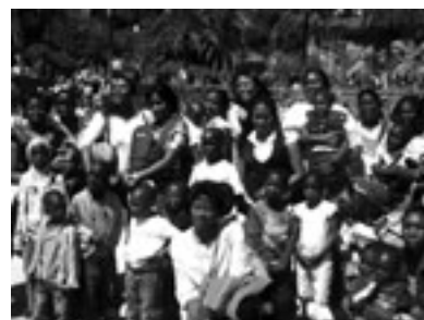
Excursió al Parc Güell