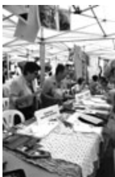
Una activitat de l'entitat

L'any 2003, un grup de dones motivades pel treball solidari i a partir d'estudis iniciats per la regidoria uns anys abans en els quals elles hi van participar, decideixen crear l'entitat: "Solidaritat tens nom de dona"